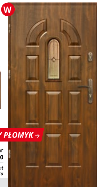
MAŁY PŁOMYK →