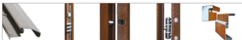
Rysunki poglądowe i przekroje znajdują się w tabeli na stronie 7.